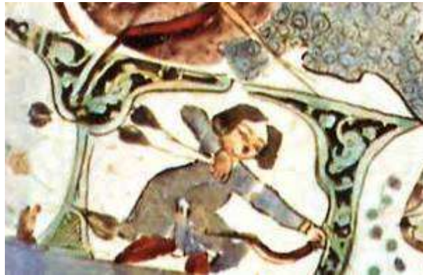
IV. Csempe a kubádábádi palotából (Törökország, a beyşehir-i tó partján). 1236 körül.

Karatay Medresesi Çini Eserler Müzesi, Konya. https://hu.pinterest.com/pin/571675746422250515/